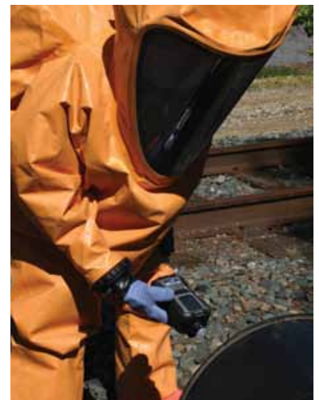
CBRN-Erfassung mit dem MultiRAE Pro